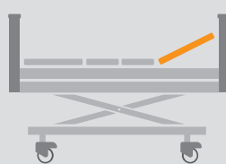
REGULACJA SEGMENTU PLECÓW