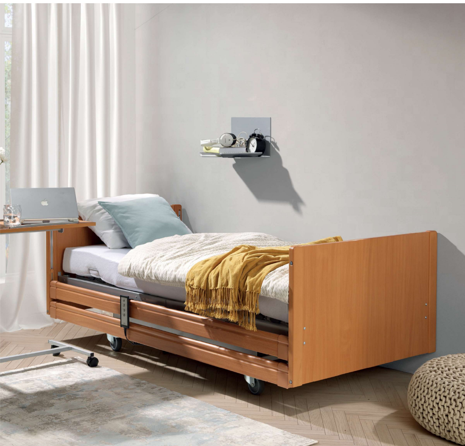
Na zdjęciu: łóżko PB 526 w rozmiarze 90×200 cm w kolorze buk. Akcesoria: stolik Rubens 9 w kolorze buk.

Najpopularniejsze łóżko z nożycowym systemem podnoszenia w ofercie Elbur. Wysokiej jakości sprawdzona konstrukcja łóżka z wieloma możliwościami konfiguracji szerokości i długości oraz duży wybór kolorystyki oraz frontów, powoduje, że ten model często wybierany jako wyposażenie placówek opiekuńczych.