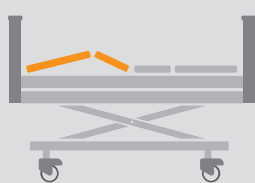
REGULACJA SEGMENTU NÓG